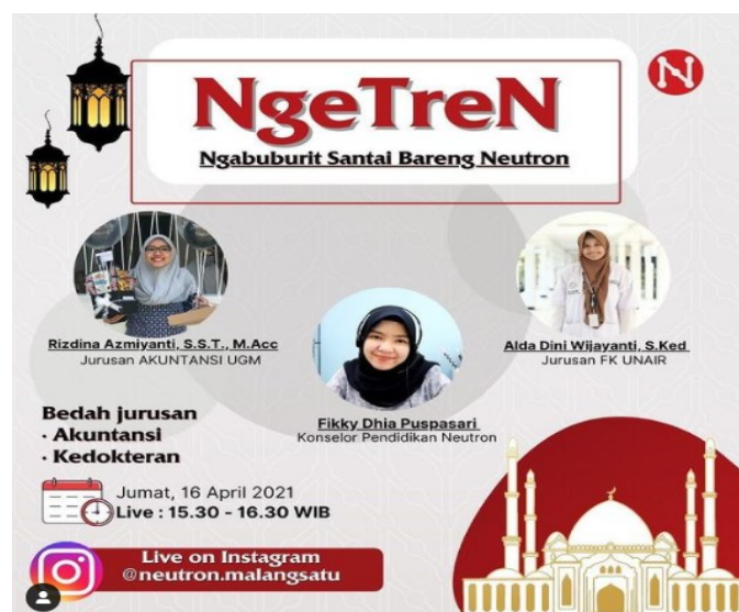
Gambar 1. Pamflet Acara Ngetren

Kegiatan sharing session ini berlangsung dengan dibuka oleh moderator dan mempersilahkan narasumber 1 untuk memaparkan materi. Materi yang dipaparkan adalah tentang bagaimana awal memilih jurusan akuntansi, mengapa memilih kampus tersebut, mata kuliah apa saja yang ditempuh, suka duka menjadi mahasiswa, dan peluang kerja di bidang akuntansi. Narasumber 2 kemudian memaparkan materi berkaitan dengan kuliah kedokteran. Seperti yang diketahui bahwa jurusan kedokteran ini merupakan salah satu yang menarik minat peserta karena ada stigma “kuliahnya lama” tetapi memiliki dampak yang baik untuk masyarakat sekitar.