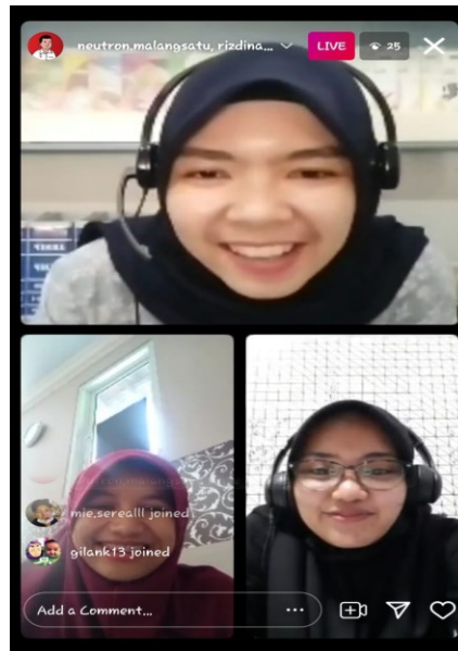
Gambar 3. Sesi Tanya Jawab

Sebelum sesi berakhir, narasumber memberikan semangat untuk para siswa dalam menghadapi ujian. Beberapa tipe ujian masuk kampus telah diatur kementerian terkait maupun kampus masing-masing. Namun, apapun bentuk ujian yang dilakukan, siswa diharapkan mempersiapkan diri sebaik mungkin dan tidak lupa untuk berdoa sebelum mengerjakan soal.